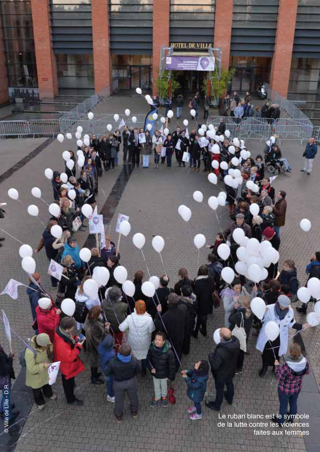
Le ruban blanc est le symbole de la lutte contre les violences faites aux femmes

Les violences faites aux femmes peuvent être